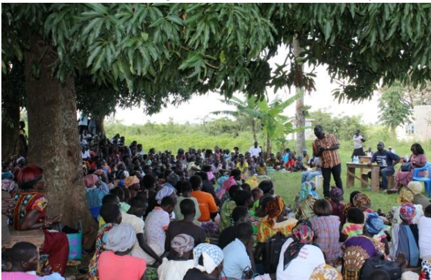
I Live Again Uganda –

Priez pour les réfugiés qui habitent dans des camps de réfugiés et des situations urbaines difficiles d'un bout à l'autre d'Ouganda. Priez pour l'approvisionnement et la restauration. Priez aussi pour la paix pour les voisins de l'Ouganda. Les troubles dans beaucoup de pays africains ne sont pas rapportés dans les médias, comme d'autres désastres et conflits, mais les défis sont sérieux. Environ 1,5 million de réfugiés se trouvent en Ouganda, plus de la moitié viennent du Soudan du Sud et plus de 32% sont de la République Démocratique du Congo. D'autres viennent de pays tels que la Somalie, le Burundi, l'Erythrée, le Rwanda, l'Éthiopie et le Soudan.