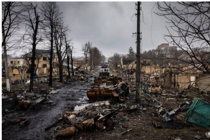
La destruction étendue à travers Bucha, en Ukraine, le dimanche, après que les forces ukrainiennes aient ciblé censément un convoi russe. Mention de source: Ivor Prickett pour The New York Times –18 avril 2022

Maintenant que vous avez imaginé cette scène, priez pour des personnes déplacées à travers le monde pour lesquelles cet exercice d'imagination est une terrible réalité. Priez pour eux dans leur chagrin et leur peine et demandez à Dieu de leur manifester sa présence. Priez aussi pour votre pays, votre ville, et votre communauté, pour qu'ils accueillent chaleureusement des gens qui ont été forcés de quitter leurs communautés.